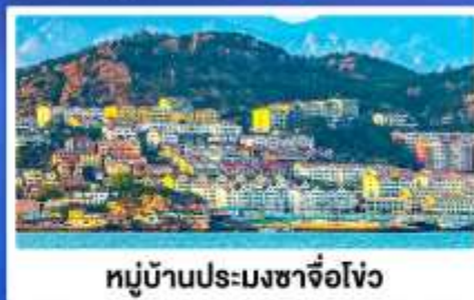
หมู่บ้านประมงซาโจ้ว