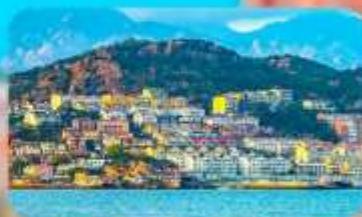
หมู่บ้านประมงซาจื่อโจว