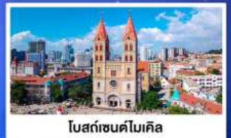
โบสถ์เซนต์โมเคิล