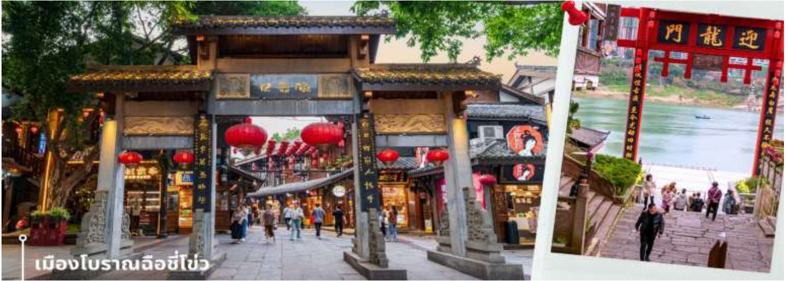
เมืองโบราณฉือชี่ไข่ว

Tel:085-4063944 letagotravel@gmail.com Line ID: @letagotravel https://www.letago.com