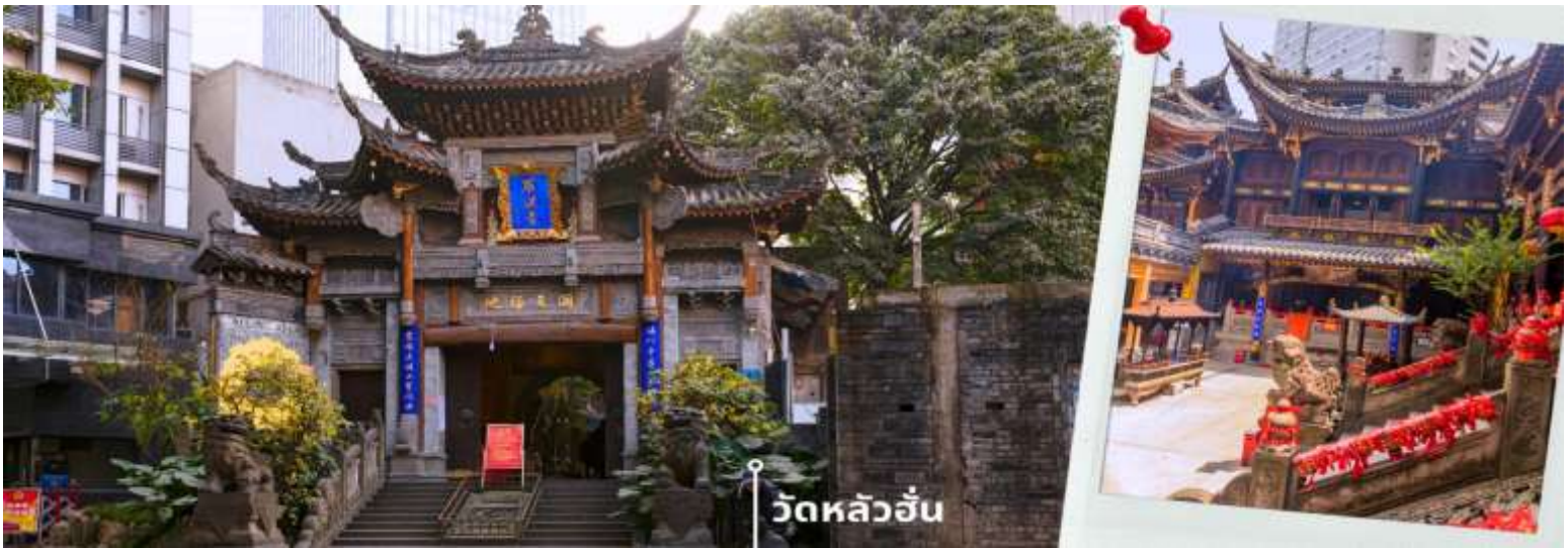
วัดหลัวอัน

นำท่านเดินทางสู่ วัดหลัวอัน (Luohan Temple) วัดสำนักงานใหญ่พุทธสมาคมแห่งนครฉงชิ่ง เป็นวัดเก่าแก่ที่สุดในฉงชิ่ง (Chongqing) ซึ่งสร้างขึ้นเมื่อ 1,000 ปีก่อน มีประวัติความเป็นมายาวนานเป็นจุดหมายทางศาสนาและเป็นศูนย์กลางของชาวพุทธในภูมิภาคการท่องเที่ยวที่สำคัญของภูมิภาค และเป็นแหล่งเรียนรู้ที่สำคัญของศิลปวัฒนธรรมจีน วัดนี้ประดิษฐานพระอรหันต์ถึง 500 องค์ แต่ละองค์มีลักษณะ ท่าทาง และสีหน้าแตกต่างกัน มีสถาปัตยกรรมแบบจีนโบราณที่สวยงามและละเอียดอ่อน พระอรหันต์ 500 องค์ แกะสลักด้วยหินและไม้ สะท้อนถึงความเชื่อในพุทธศาสนาและมีฝีมือศิลปะจีน