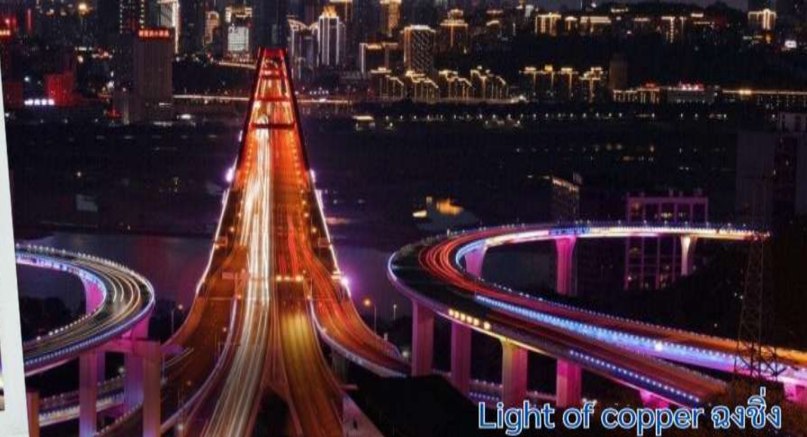
Light of copper ฉงชิ่ง