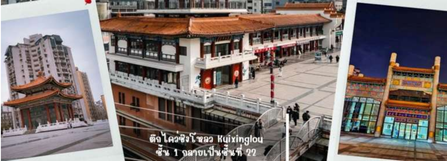
ตึก ไคว่ซิง โหลว Kujinglou ชั้น 1 กลายเป็นชั้นที่ 22

ประเทศจีน เนื่องจากภูมิประเทศที่เป็นภูเขา อาคารแห่งนี้จึงมีทางเข้าในระดับที่ต่างกัน เป็นจุดถ่ายรูปและชมวิวที่โดดเด่นของเมืองฉงชิ่งที่ได้ชื่อว่าเป็น "เมืองสามมิติ"