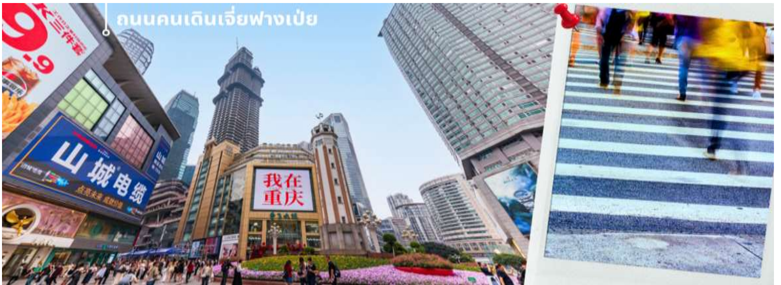
คำ รับประทานอาหาร ณ ภัตตาคาร (7)

อิสระข้อปั้ง ย่านเจี่ยฟางเป่ย์ ย่านธุรกิจสุดหรู ใจกลางเมืองฉงชิ่งความเป็นจริงแล้ว ที่นี่เรียกได้เป็นใจกลางเมืองที่มีแหล่งธุรกิจต่างๆ ซึ่งรวมไปด้วยทั้งตึกสูง แหล่งรวมแบรนด์เนมชื่อดังต่างๆ ที่ใครมาเมืองฉงชิ่งแล้วนั้น จะต้องมาเดินเที่ยวที่นี่ เป็นสถานที่สุดฮิตของวัยรุ่นฉงชิ่ง คล้ายกับสยามบ้านเรา เป็นแหล่งข้อปั้งแบรนด์ดังหลายแบรนด์รวมอยู่ที่นี่ มีร้านอาหาร ร้านหม่าล่า คาเฟ่ เป็นอีกที่ที่ต้องแวะซื้อป ซิมกันแบบจุกๆ ตรงนี้ถ่ายรูปสตรีทๆออกมาได้ชิคมากๆ