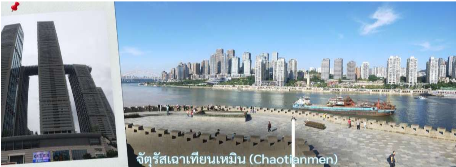
จัตุรัสเฉาเทียนเหมิน (Chaotianmen)

จากนั้น นำท่านเดินทางสู่ จัตุรัสเฉาเทียนเหมิน ซึ่งตั้งอยู่ ณ จุดบรรจบของ แม่น้ำแยงซี และ แม่น้ำเจียหลิง นับเป็นท่าเรือขนส่งทางน้ำที่ใหญ่ที่สุดของนครฉงชิ่ง และเป็นศูนย์กลางการค้าสำคัญมาอย่างยาวนาน บริเวณนี้ยังเป็นที่ตั้งของ ตลาดการค้าครบวงจรเฉาเทียนเหมิน ซึ่งถือเป็นตลาดขนาดใหญ่ที่สุดของฉงชิ่ง ทำให้พื้นที่โดยรอบเต็มไปด้วยผู้คนและมีชีวิตชีวาอยู่เสมอ ตั้งแต่อดีตจนถึงปัจจุบัน จัตุรัสแห่งนี้ได้รับการออกแบบให้มีลักษณะคล้ายเรือยักษ์ที่กำลังแล่นออกสู่สายน้ำอย่างสง่างาม จึงได้รับสมญานามว่า "โททานิคแห่งฉงชิ่ง" เมื่อยืนอยู่บนจัตุรัส ท่านจะสามารถมองเห็นภาพอันน่าประทับใจของจุดบรรจบระหว่างแม่น้ำสองสาย โดยน้ำสีเหลืองของแม่น้ำแยงซีและน้ำสีเขียวมรกตของแม่น้ำเจียหลิงไหลมาบรรจบกันอย่างชัดเจน สร้างทัศนียภาพที่สวยงามและเป็นเอกลักษณ์ของฉงชิ่งอย่างแท้จริง