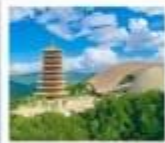
กุหาหนิวโล่วชาน