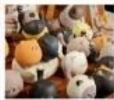
โรงงานเซรามิกเตาเอ้อฉ่าง