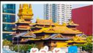
วัดจิงอัน

ล่องเรือสุดโรแมนติกแม่น้ำหวงผู้ จักรัสเทียนอันเหมิน จักรัสใหญ่ที่สุดในโลก ใจกลางประวัติศาสตร์จีน พระราชวังต้องห้าม พระราชวังโบราณสุดอลังการ มรดกโลกยูเนสโก ถนนเทียนกิง แหล่งช้อปปิ้งสุดฮิต แบนด์เนม พงษ์ผากเพียว