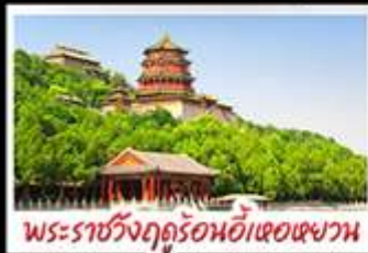
พระราชวังฤดูร้อนอ้าหอยวน

ท่าอากาศยานจีนคานจวียงทวน - พระราชวังฤดูร้อนอ้าหอยวน สวนจิ้งอัน - วัดลามะ - ไหม่หลงร้านช้อปปิ้ง - โรงแรม 4 ดาว นี้อพิศข นีคปักกิ่ง สุกั่มองโก MICHELIN GUIDE ร้าน TAO TAO JU