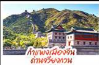
กำแพงเมืองจีน ถ้ำมอถิง

ล่องเรือสุดโรแมนติกแม่น้ำหวงผู้ ปักกิ่ง...มีประตูสู่แดนมังกร ด้วยความอลังการระดับจักรพรรดิ ซิงเต่า...เมืองชายทะเลสไตล์ยุโรป ภูเขาแบบผ่อนคลาย เซี่ยงไฮ้...มหานครแห่งเอเชีย เมืองที่ไม่เคยหลับไหล