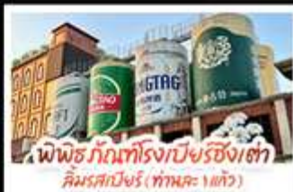
พิพิธภัณฑ์โรงเบียร์ชิงเต่า คิมมอสเบียร์ (ท่าอากาศยาน)