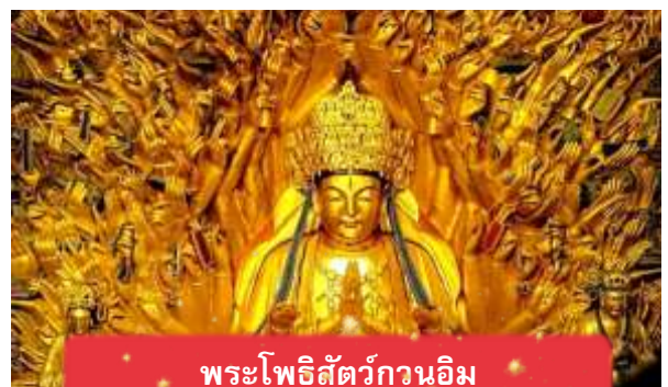
พระโพธิสัตว์กวนอิม

นำท่านเดินทางสู่ มรดกโลกอุทยานผาหินแกะสลักต้าจู๋ ศิลปะหินแกะสลักอันล้ำค่าแห่งเมืองฉงชิ่งมรดกโลกที่องค์การยูเนสโกขึ้นทะเบียนเมื่อปี ค.ศ. 1999 ตั้งอยู่ทางตะวันตกของนครฉงชิ่ง ประเทศจีน ศิลปะหินแกะสลักเหล่านี้สร้างขึ้นตั้งแต่ราชวงศ์ถังจนถึงราชวงศ์ซ่ง มีอายุมากกว่า 1,000 ปีโดดเด่นด้วยงานแกะสลักทางพุทธศาสนาที่งดงามและยังคงสภาพสมบูรณ์ (ใช้เวลาเดินทางประมาณ 1-2 ชั่วโมง)