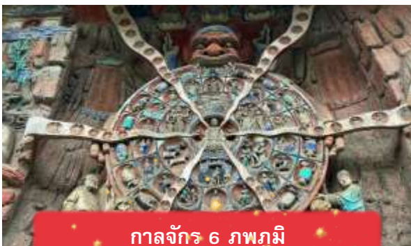
กาลจักร 6 ภพภูมิ

ไฮไลท์ที่ไม่ควรพลาด พระไสยาสน์ปางปรินิพพาน รูปสลักพระพุทธเจ้าในปางไสยาสน์ยาวกว่า 30 เมตร แสดงเหตุการณ์เสด็จดับขันธปรินิพพาน พระพักตร์สงบงดงาม สื่อถึงการเข้าถึงนิพพานอย่างสงบเย็น พระโพธิสัตว์กวนอิม ปางสหเนตรสหหัตถ์ งานแกะสลักยิ่งใหญ่ แสดงพระโพธิสัตว์กวนอิมที่มี 1,007 พระกร แต่ละพระกรมีพระเนตรบนฝ่ามือ แทนการมองเห็นทุกข์และช่วยเหลือสรรพสัตว์ทุกทิศทาง กาลจักร 6 ภพภูมิ ภาพสลักที่ถ่ายทอดวงจรสังสารวัฏ ทั้ง 6 ภพภูมิ ได้แก่ เทวดา มนุษย์ อสูร สัตว์เปรต และนรก สะท้อนกฎแห่งกรรมและการเวียนว่ายตายเกิด พระไวโรจนพุทธ รูปสลักพระไวโรจนะแสดงพระพักตร์สงบนิ่ง เปล่งรัศมีสว่างไสว เป็นสัญลักษณ์แห่งปัญญาสูงสุดและการตรัสรู้ที่ครอบคลุมสรรพสิ่ง เที่ยง บริการอาหารกลางวัน ณ ภัตตาคาร