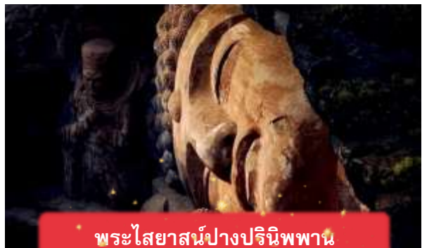
พระไสยาสน์ปางปรินิพพาน