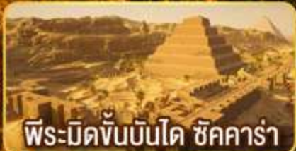
พีระมิดขั้นบันได ชิคคาร์่า