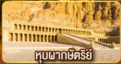
คูบผากษัตริย์