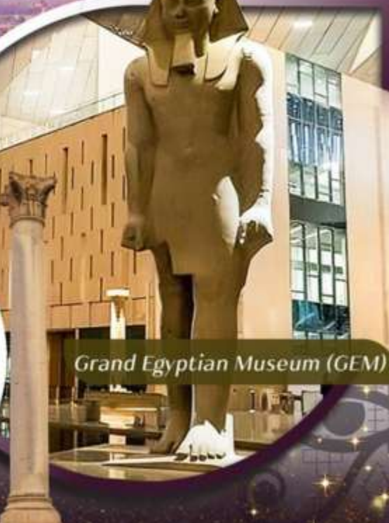
Grand Egyptian Museum (GEM)