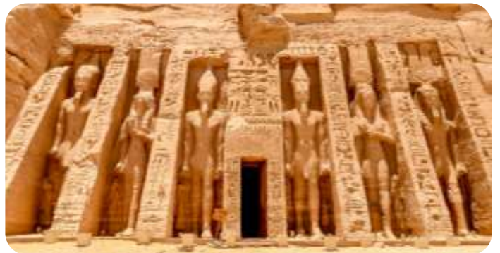
สมควรแก่เวลาทำท่านเดินทางกลับเมืองอัสวาน