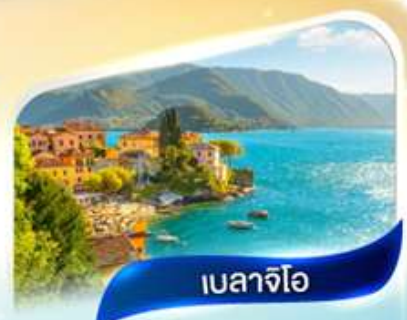
เบลลาจีโอ