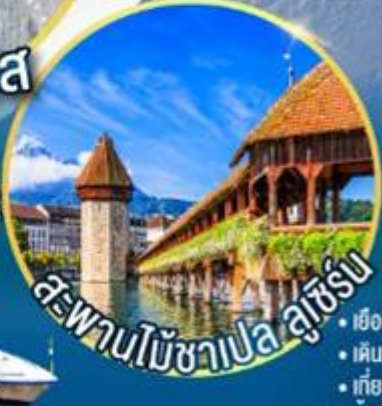
สะพานไม้ชาเปล ลูเซิร์น