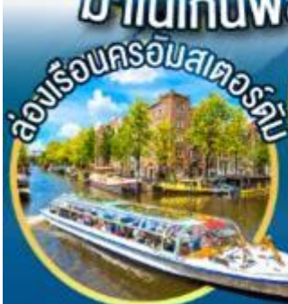
ล่องเรือครอัมสเตอร์ดัม