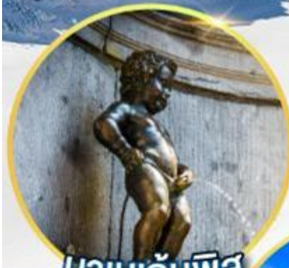
มานกันพีส์