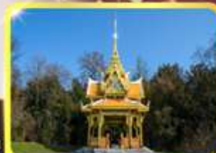
ศาลาไทยไชยาบน์