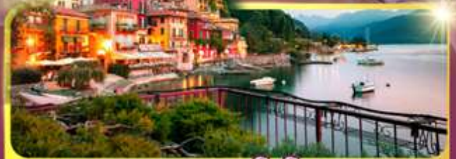
ทะเลสาบโลโบ