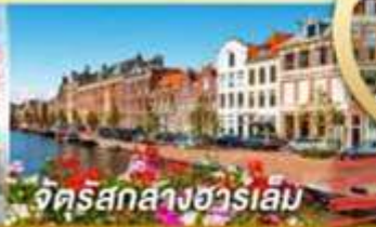
จัตุรัสกลางฮาร์เลม