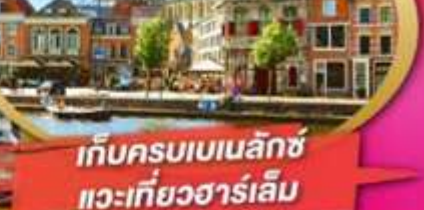
เก็บครบเบนเนลักซ์ แะเที่ยวฮาร์เลม