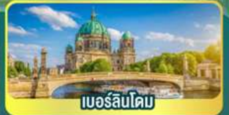
เบอร์ลินโดม