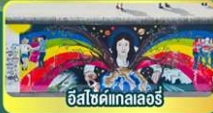
อีสไซด์เทลเลอร์