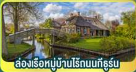
ส่องเรือหมู่บ้านไรกนบักตุร์บ