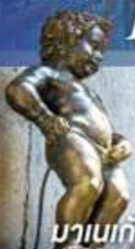
มานเนกันพิส