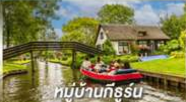
หมู่บ้านทีธูร์น