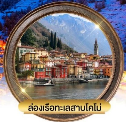
ล่องเรือทะเลสาบโคโม