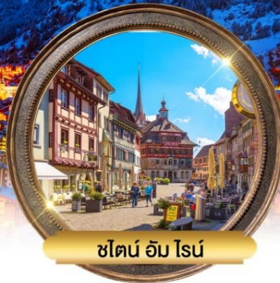
ชไตน์ อัม ไรน์