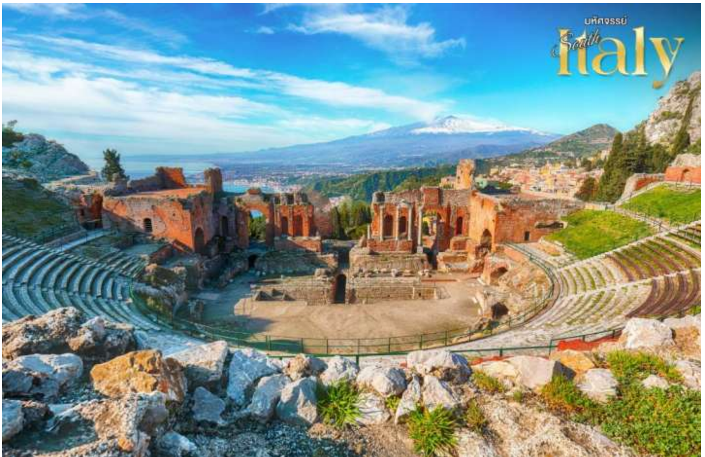
เกาะหลักของอิตาลี โดยจะลงที่ เมือง Reggio Calabria

พาท่านสู่ Teatro Greco อัฒจันทร์เก่าแก่ ไฮไลท์ของเมือง สร้างในยุคกรีกโบราณ สันนิษฐานว่าสร้างประมาณ 300 ปีก่อนคริสตกาล ด้วยทัศนียภาพที่เมืองล่างเป็นทะเลเมดิเตอร์เรเนียน และจากหลังเป็นภูเขาไฟแอตน่า ทำให้บรรยากาศที่ความสวยงามแตกต่างจากโรงละครอื่นๆ