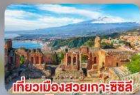
เที่ยวเมืองสวยเก่า-ซิซิลี Taormina