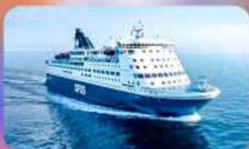
พิกบนเรือสำราญ แบบ Window Room 1 คืน