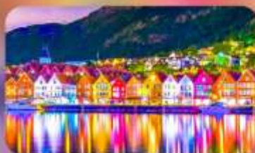
พิกเบอร์เกน 1 คืน