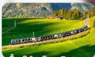
นั้งรถไฟสายโรแมนติก 2 สาย Golden Pass / Luzern Interlaken Express