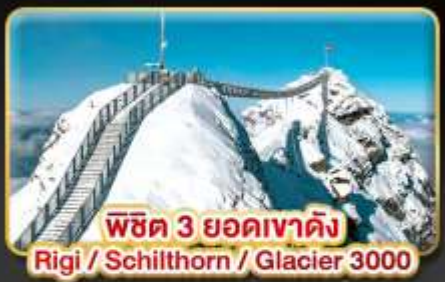
พีชิต 3 ยอดเขาค้าง Rigi / Schilthorn / Glacier 3000