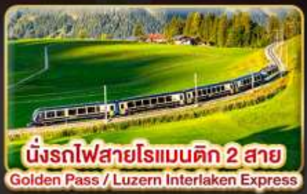
นั่งรถไฟสายโรเมนติก 2 สาย Golden Pass / Luzern Interlaken Express