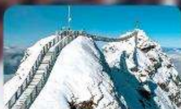
พิชิต 3 ยอดเขาดัง Rigi / Schilthorn / Glacier 3000