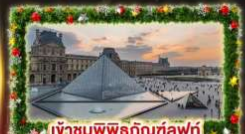
เจ้าชมพีพีร์กัณฑ์ลูฟท์