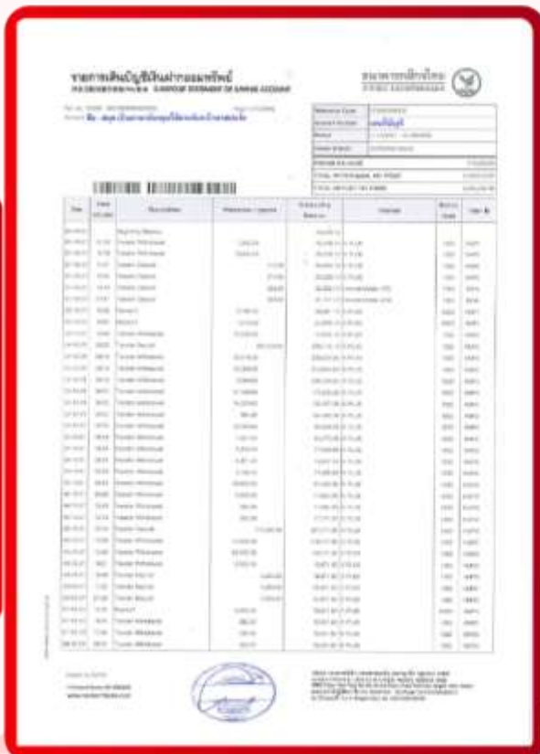
ตัวอย่าง Bank Statement ที่ผู้สมัครต้องขอจากธนาคาร

3.3 ปรับสมุดบัญชีธนาคารตัวจริง และเตรียมไปในวันที่ยื่นวีซ่า