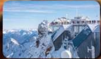
พิชิต Zugspitze Top Of Germany