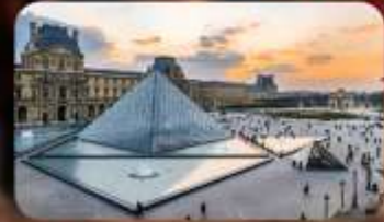
เข้าชมพิพิธภัณฑ์ลูฟวร์