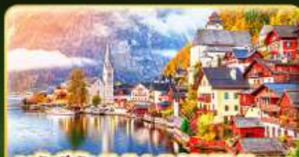
การันตีพัก Hallstatt / St. Wolfgang หรือริมทะเลสาบ 1 คืน