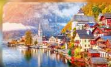
การันตีพัก Hallstatt/St.Wolfgang หรือริมทะเลสาบ 1 คืน