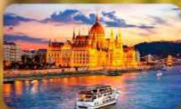
ล่องเรือแม่น้ำดานูบ ช่วง Twilight พร้อมจิบแชมเปญ