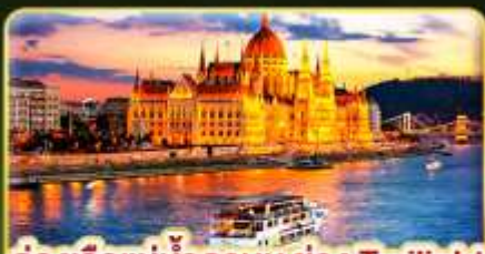
ล่องเรือแม่น้ำดานูบ ช่วง Twilight พร้อมจิบแชมเปญ

📅 เดินทาง: 02-09 ธ.ค. | 06-13 ธ.ค. 10-16 ธ.ค. 69