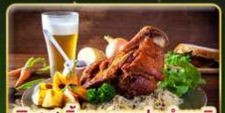
พิเศษ! ลิ้มลองเมนูประจำชาติ ถึง 5 ประเทศ!!