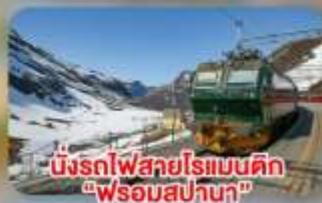
นั่งรถไฟสายโรแมนติก "พร้อมสปาเท้า"