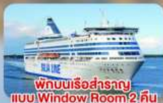
พักบนเรือสำราญแบบ Window Room 2 คืน