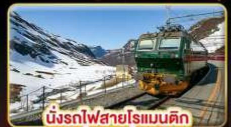
นั่งรถไฟสายโรแมนติก “พร้อมสปา”