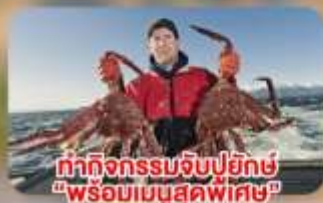
ทำกิจกรรมจับปลึกซ์ "พร้อมเมนูสุดพิเศษ"