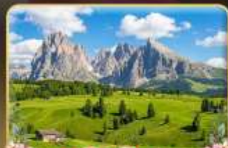
ชมวิวลังการ alpe di siusi