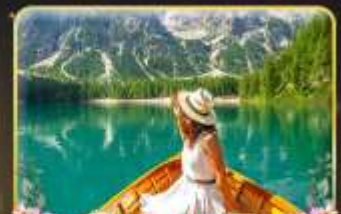
พายเรือทะเลสาบ Braies