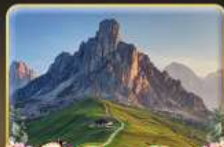
เยือน Passo Giau