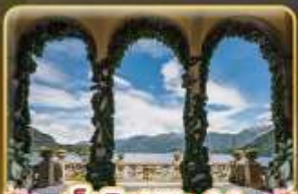
เชคอิน Villa del Balbianello

ที่สุดของธรรมชาติแห่งอิตาลี ทิวเขา ทะเลสาบ ความงามแห่งโคโลโม