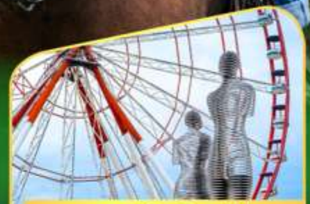
อนุสาวรีย์อาลีและบีโน