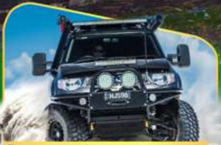
ขึ้นรถ 4WD สู้อีกกลางเทือกเขาคอเคซัส