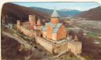
ป้อมอนาบูรี