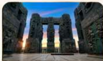
อนุสรณ์ประวัติศาสตร์จอร์เจีย