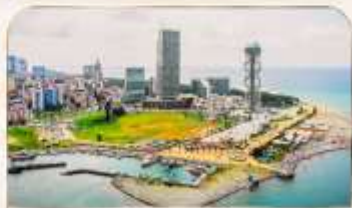
เมืองชายทะเล บาดูมี