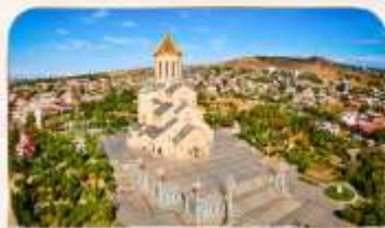
โบสถ์กรินิตี