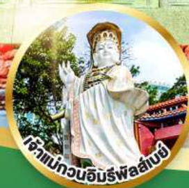
เจ้าแม่กวนอิมรับพลานามัย