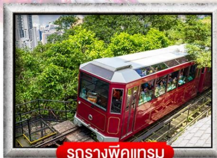
รถรางพิกแตรม