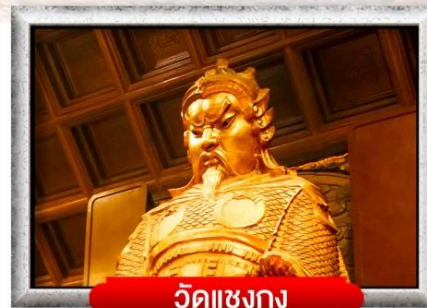
วัดแชงกง