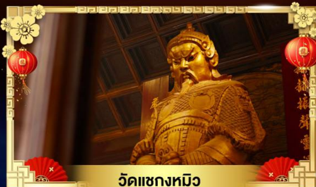
วัดแซกงหมิว

หมูนกั๊งหันนำโชควัดแซกง ส่วนสนุกตีสนีย์แลนด์เต็มวัน