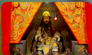
องค์แขกเก่า 600 ปี