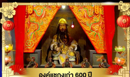
องค์แซกงเก่า 600 ปี