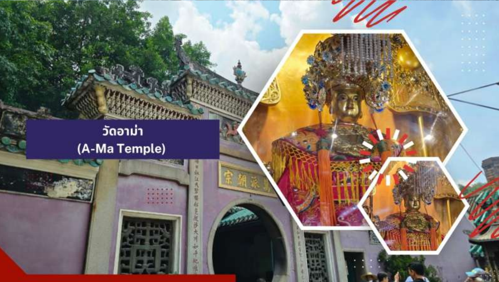
วัดอาม่า (A-Ma Temple)