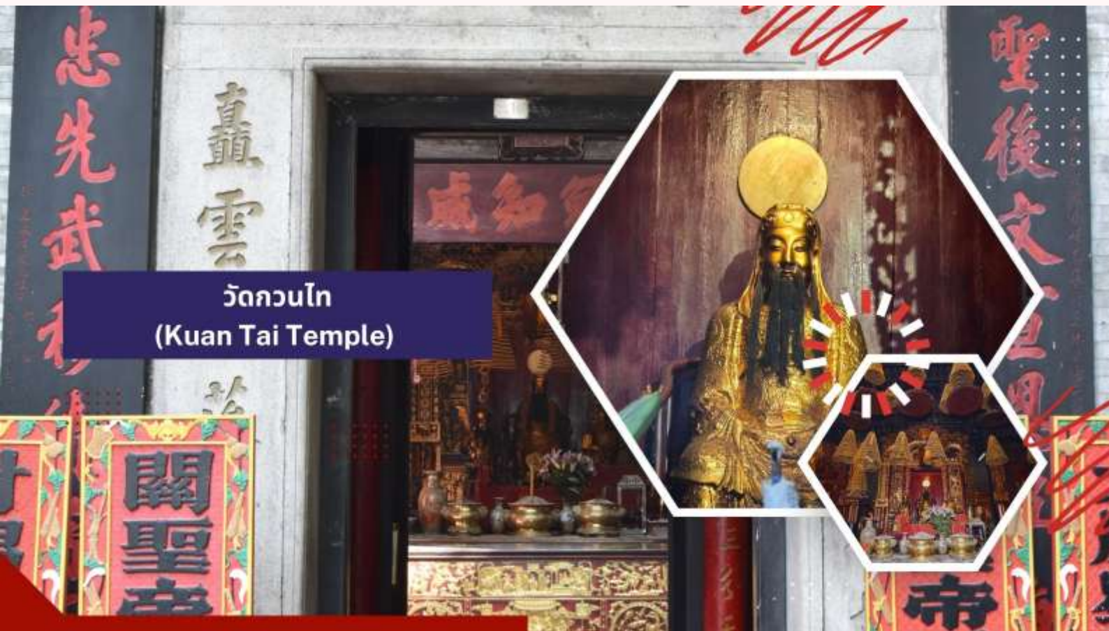
วัดกวนไท (Kuan Tai Temple)

นำท่านเดินทางสู่ วัดกวนไท (Kuan Tai Temple) หรือรู้จักกันในชื่อ วัดชำไถ่กุยคุน (Sam Kai Vui Kun Temple) เป็นวัดที่มีความสำคัญทางประวัติศาสตร์และวัฒนธรรมในมาเก๊า ได้รับการขึ้นทะเบียนเป็นมรดกโลกของ UNESCO ร่วมกับศูนย์กลางประวัติศาสตร์มาเก๊าในปี ค.ศ. 2005 เนื่องจากคุณค่าทางประวัติศาสตร์ สถาปัตยกรรม และวัฒนธรรมที่โดดเด่น ตั้งอยู่ใจกลางจัตุรัสเซนาโด้และรายล้อมไปด้วยอาคารสไตล์ยุโรป วัดนี้สร้างขึ้นเมื่อปี ค.ศ. 1750 และเป็นที่ประดิษฐานของเทพเจ้ากวนอู ซึ่งเป็นเทพเจ้าแห่งความมั่งคั่งและปกป้องคุ้มครอง วัดแห่งนี้มีเป็นที่นิยมของผู้ทำธุรกิจ ตำรวจ และนักการเมือง เพราะเชื่อว่าสามารถปกป้องสิ่งชั่วร้ายต่างๆ และช่วยเสริมอำนาจบารมีในการปกครองและคุ้มครองบริวาร