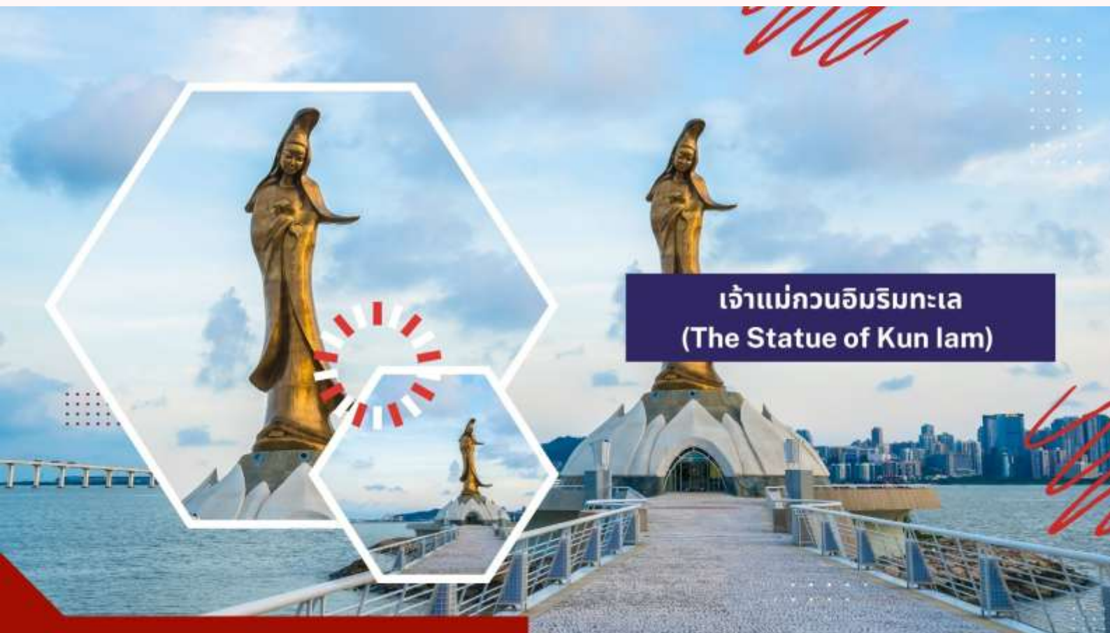
เจ้าแม่กวนอิมริมทะเล (The Statue of Kun lam)

นำท่านชม เจ้าแม่กวนอิมริมทะเล (The Statue of Kun lam) เจ้าแม่กวนอิมประจักษ์ทองสร้างด้วยทองสัมฤทธิ์ทั้งองค์ มีความสูง 18 เมตร หนักกว่า 1.8 ตัน ประดิษฐานอยู่บนฐานดอกบัวดูงดงามอ่อนช้อย สะท้อนกับแดดเป็นประกายเรืองรองเหลืออร่ามงดงาม จับตา เจ้าแม่กวนอิมองค์นี้เป็นเจ้าแม่กวนอิมลูกครึ่ง คือ ปั้นเป็นองค์เจ้าแม่กวนอิมแต่ว่ากลับมีพระพักตร์เป็นหน้าพระแม่มาลีที่เป็นเช่นนี้ก็เพราะว่าเป็นเจ้าแม่กวนอิมไปตุเกสตั้งใจสร้างขึ้นเพื่อเป็นอนุสรณ์ให้กับมาเก๊าในโอกาสที่ส่งมอบมาเก๊าคืนให้กับจีน