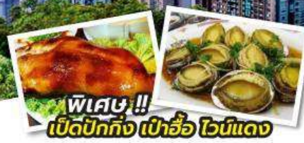
พิเศษ !! เปิดปีกถึง เป้าชื้อ โชนแดง