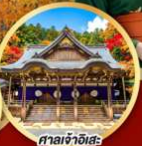
ศาลเจ้าฮิสะ