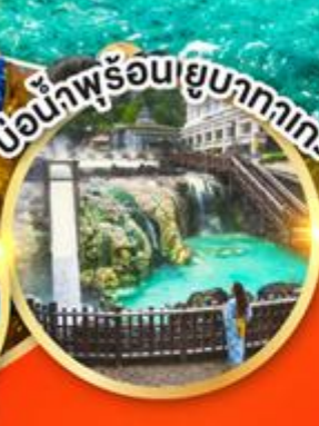
น้ำพุร้อนยูบาคาเกะ