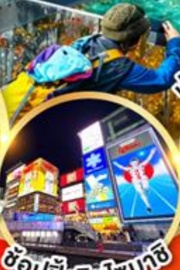
ช้อปปิ้งชินโจบาชิ