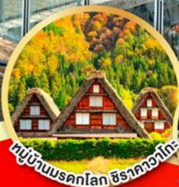
หมู่บ้านมรดกโลก ชิราคาวาโกะ