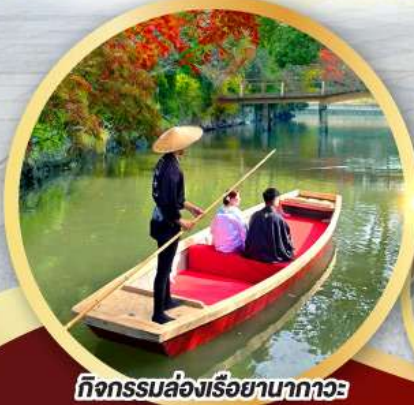
กิจกรรมล่องเรือยานากาวะ