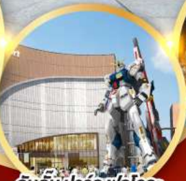
กันดั้ม ปาร์ค ฟุคุโอกะ