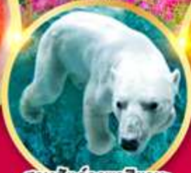
สวนสัตว์อาซาฮิยามะ