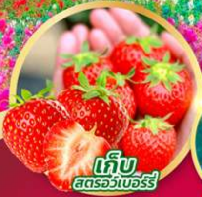
เก็บ สตอร์วเบอร์รี่