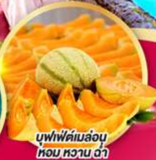
บุฟเฟ่ต์เมล่อน หอมหวาน ฉ่ำ