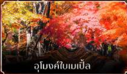
อุโมงค์ไเบเมเปิ้ล