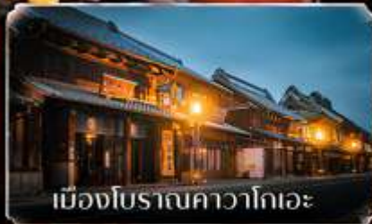
เมืองโบราณคาวาโกเอะ