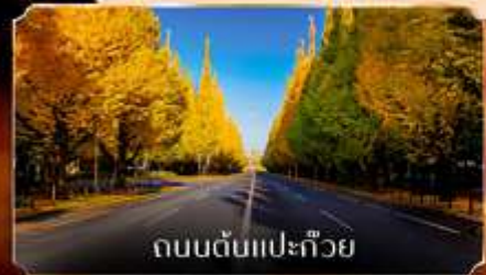
ถนนต้นแปะก๊วย