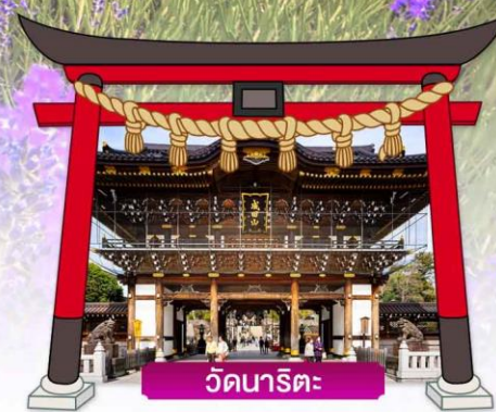
วัดนาริตะ