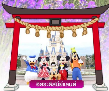
อิสระ-ดิสนีย์แลนด์