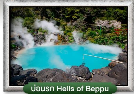
บ่อน้ำร้อน Hells of Beppu