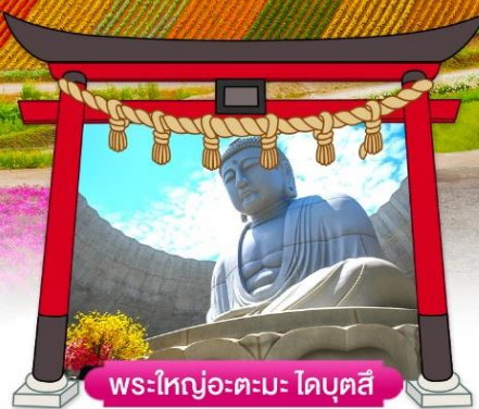
พระใหญ่อะตะมะ ไดบุตสึ