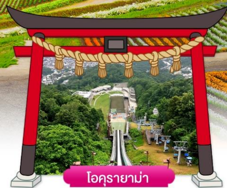
โอคุรายามา