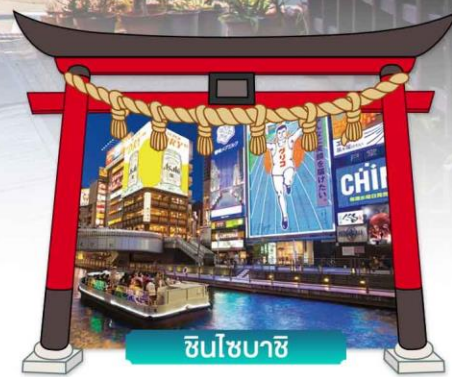
ชินโซบาชิ