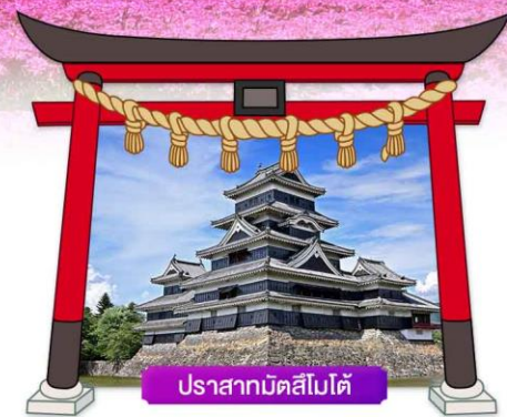
ปราสาทมัตสึโมโต้