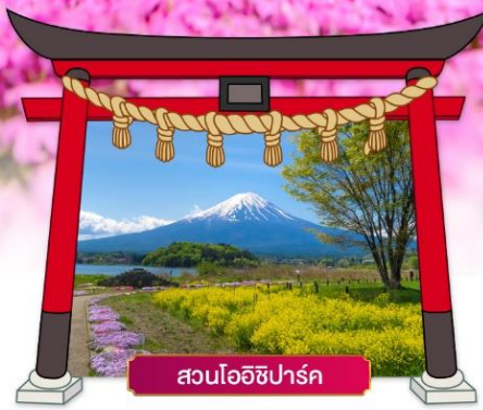
สวนโออิชิปาร์ค