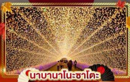
นาคานาชิมาออนเซ็น

"ชมความงามของฤดูใบไม้เปลี่ยนแล้ว" เที่ยวครบจบทุกไฮไลท์ โอซาก้า-โตเกียว พิเศษ!! บินแอร์แบบ FULL SERVICE