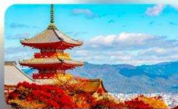
วัดคิโยมิชิ