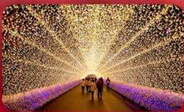
นาบานาโนะซาโตะ