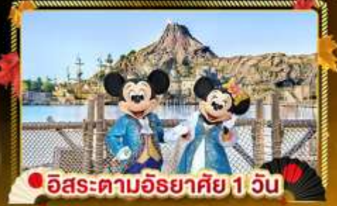
อิสระตามอริยาตสึ 1 วัน