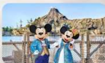
อีสร-ตามอริยาศัย 1 วัน