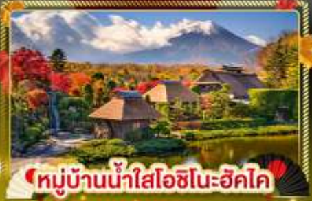
หมู่บ้านน้ำใสโอชิโนะฮักได