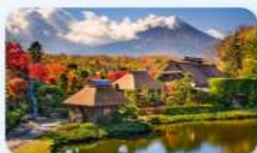
หมู่บ้านน้ำใสโอชิโนะฮักโค