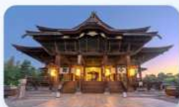
วัดเซ็นโคจิ นากาโนะ