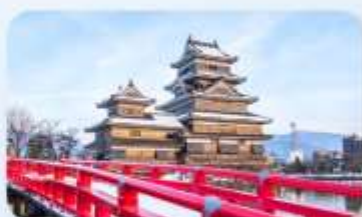
ปราสาทมิตสึโมโตะ