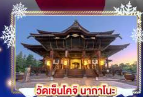
วัดเซ็นโคจิ นากาโนะ