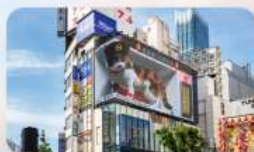
ช้อปปิ้งชินจุกุ