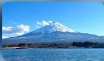
ทะเลสาบคาวากุจิ