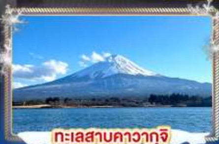
ทะเลสาบคาวากุจิ