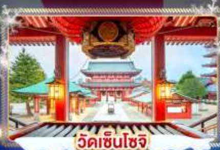
วัดเซ็นโซจิ