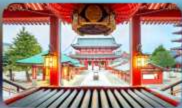
วัดเซ็นโซจิ

HOTEL HEDISTAR NARITA หรือเทียบเท่ามาตรฐานญี่ปุ่น