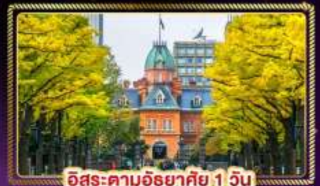
อีสระตามอียาคัย 1 วัน