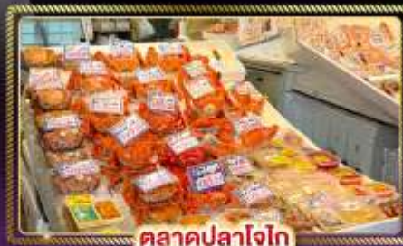
ตลาดปลาโอโก