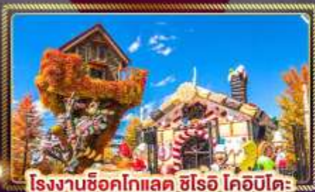
โรงงานช็อคโกแลต ชิโรอิ โคอิบิโตะ