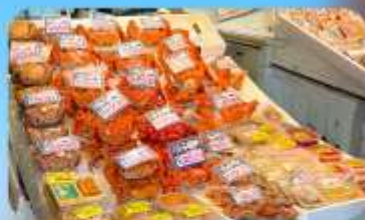
ตลาดปลาโจโก