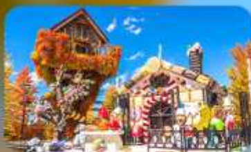
โรงงานช็อกโกแลตชิโรอิ โคอิบิโตะ