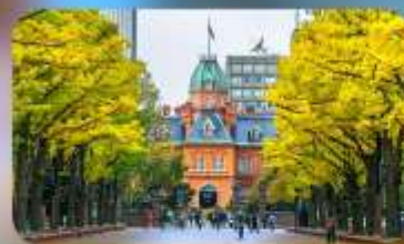
อึสะะตามอึสะะคัย 1 วัน