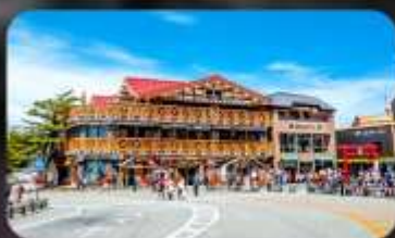
ฟูจิชั้น 5