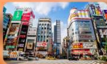
ซ้อปปิ้งชินจูกุ