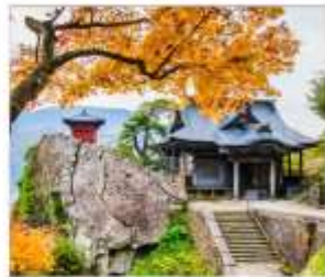
วัดยามาเดระ