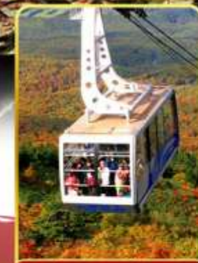
นั่งกระเช้าอากิโกะ