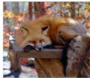
ฟาร์มสุนัขจิ้งจอก