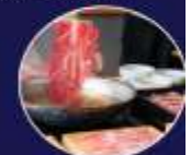
เมนูท้องถิ่นขึ้นชื่อกับเมนู "วากายามะฟาร์ม เสิร์ฟพร้อมชาเขียว"