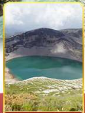
ปากปล่องภูเขาไฟฮาโอ