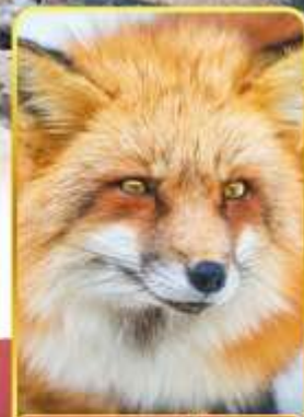
ฟาร์มสุนัขจิ้งจอก