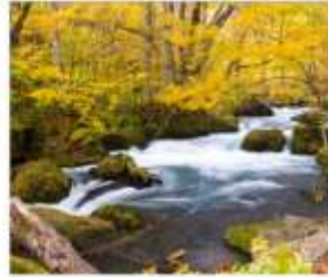
เดินเล่นลำธารโอะอิราสะ