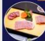
บุฟเฟ่ต์ ซาซุสไตล์ญี่ปุ่น