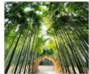
ป่าไผ่วากายามะ