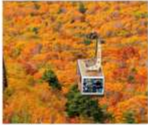
นั่งกระเช้าฮักโกดะ