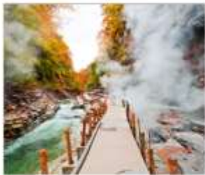
ชมเขาโอยาสึเดียว