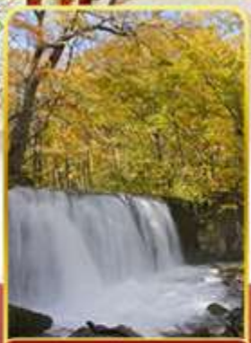
ลำธารโออิราเสะ