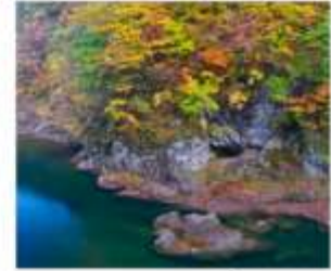
ชมเขาดากิไดริ